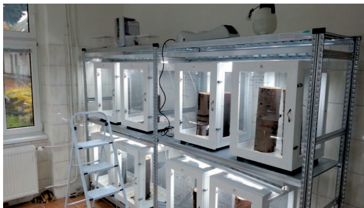
Obrázok 1. Umelé chovy podkôrneho hmyzu v chovných klieťkach

Popis a riešenie: Na chov hmyzu boli využívané rôzne druhy fotoeklektorov, chovných klieťok (obr. 1) a iných typov závesných sieťových chovných systémov používaných napríklad v Kanade. Modelovými druhmi podkôrneho hmyzu boli najmä podkôrnikovitité (Scolytidae) na smreku (lykožrút smrekový Ips typographus , lykožrút lesklý Pityogenes chalcographus , lykožrút severský Ips duplicatus ) a náš najvýznamnejší podkôrny škodca v dubinách, podkôrnik dubový ( Scolytus intricatus ).