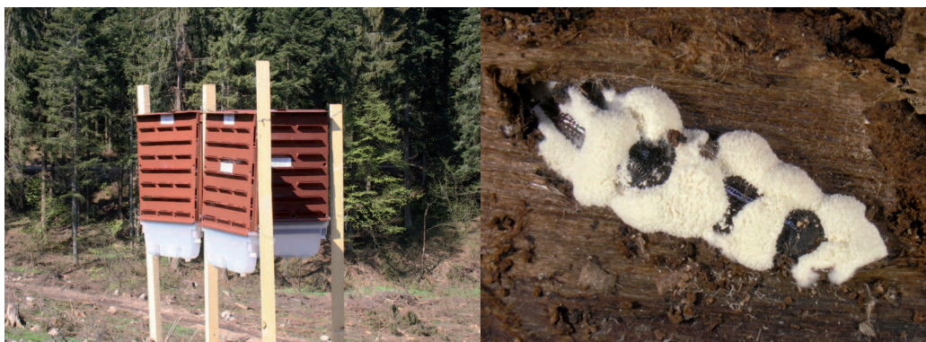
Obrázok 2. Upravené lapače v zostave a lykožrúty infikované entomopatogénnou hubou Beauveria bassiana

Popis a riešenie: Pokusy prebiehali v oblasti Kysúc, v porastoch so silným kalamitným premnožením podkôrneho hmyzu. Vegetačná sezóna 2013 bola z pohľadu aplikácie entomopatogénnych húb menej vyhovujúca. Jarné rojenie podkôrneho hmyzu bolo slabé. Chladné a daždivé počasie spôsobilo, že trvalo len niekoľko dní. Naopak letné rojenie bolo silné, vďaka extrémnym suchám a vysokým teplotám. Tieto extrémne podmienky však nevytvorili vhodné podmienky pre úspešnú aktivizáciu entomopatogénnych húb v populácii podkôrneho hmyzu. Prípravok Boverol bol testovaný počas letného rojenia v upravených lapačoch na lykožrúta smrekového a v lapačoch na lykožrúta severského. Na vzorkách odobratých z požerkov však bola zistená veľmi malá prítomnosť entomopatogénnej huby, ktorú obsahuje prípravok Boverol. Patogén bol zistený len v požerkoch lykožrúta severského. Aj keď boli dospelé imága v lapačoch (obr. 2) úspešne infikované, spóry huby si v extrémne teplých a suchých podmienkach zbernej nádoby lapača nepodržali dostatočnú biologickú účinnosť. Z tohto dôvodu sa nedokázali aktivizovať v populácii podkôrneho hmyzu.