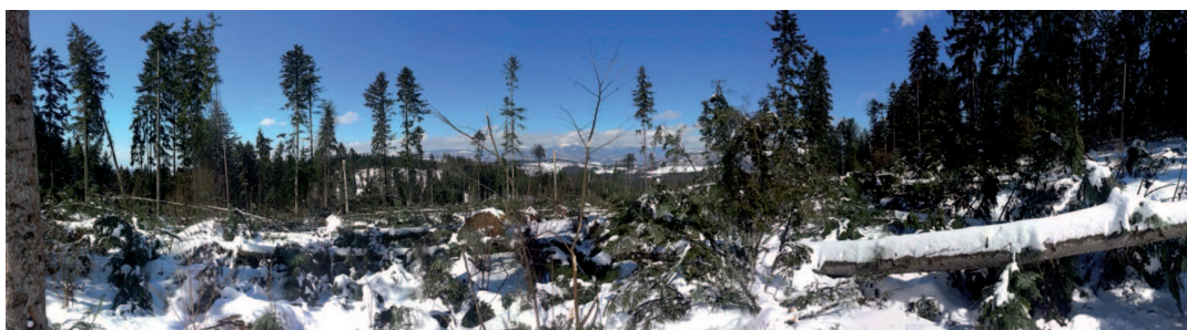
Obrázok 1. Poškodený porast veternou kalamitou v Obecnom podniku lesov, s. r. o., Poniky

Predispozíciou poškodenia v tomto subjekte bola rozmočená pôda po teplom a daždivom počasí trvajúcim niekoľko dní predtým, počas ktorého došlo aj k roztopeniu snehu a zvýšeniu tak zásoby vody v pôde. Podľa vtedajších predbežných odhadov bolo poškodených 16,3 tis. m 3 drevnej hmoty na výmere približne 30,5 ha. Išlo najmä o ihličnaté porasty takmer všetky v rubnom veku (prebierky len asi 200 m 3 ), kde prevládala jedľa biela a čiastočne boli poškodené aj smrekky (obr. 1). Stromy boli z 90 % vyvrátené aj s koreňovými koláčmi, zvyšok boli zlomy. Väčšia časť kalamitnej hmoty bola sústredená, avšak vyskytovali sa aj jednotlivé zlomy a vývraty v zapojených okolitých porastoch (rozptýlená kalamita).