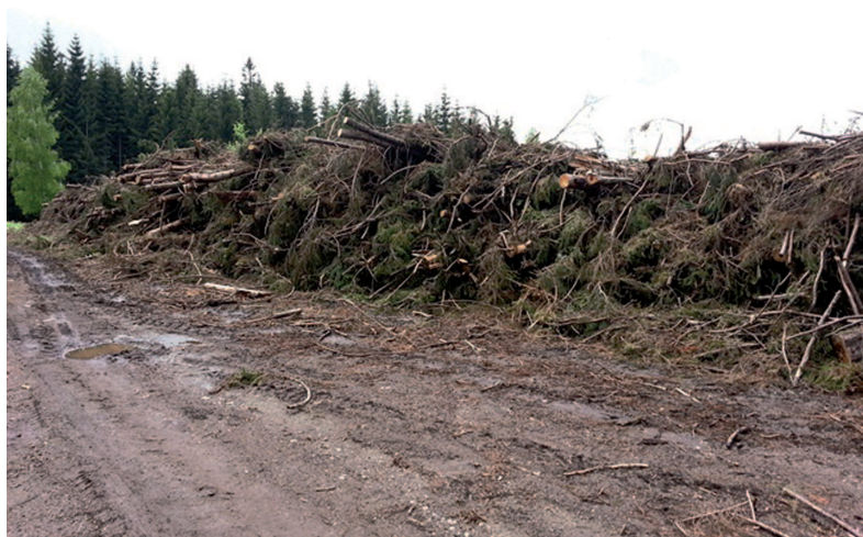
Obrázok 3. Ťažbové zvyšky pripravené na štiepkovanie na OM