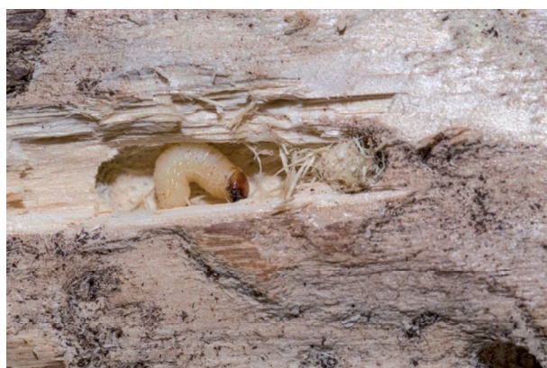
Obrázok 2. Larva tvrdoňa v kuklovej kolíske

Po ukončení chovu začiatkom februára 2014 (liahnutie imág F_1 bolo dokončené), sme urobili analýzu klátov, pri ktorej boli spočítané všetky výletové otvory, kuklové kolísky (obr. 2) a tiež nájdené larvy, kukly a imága. Kuklové kolísky boli nájdené pod kôrou a tiež hlbšie v dreve. Výsledky tejto analýzy sú uvedené v tabuľke 2.