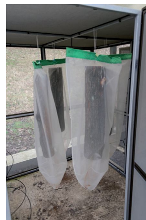
Obrázok 4. Dubové kláty zavesené v externej kletke

V ďalšom experimente prebiehali pozorovania vývoja podkôrníka dubového vzhľadom na zmenu teplotných pomerov. Pozorovanie začalo už v roku 2012 a použili sme naletený dubový lapák z LS Duchonka, ktorý sme napílili na asi 80 cm dlhé kláty. Hrúbka sa pohybovala v rozpätí 14 – 28 cm. Kláty sme rozdelili na 4 skupiny. V každej skupine bol klát hrubý (spodná časť kmeňa), stredný (prostredná časť kmeňa), tenký (vrchná časť kmeňa) a kontrolný, ktorý slúžil na priebežnú kontrolu vývojových štádií podkôrníka. Jednu skupinu sme ponechali v externých podmienkach porastu, ostatné tri sme navliekli do vakov zo sieťoviny a so zbernou nádobkou a umiestnili do klimaboxov. Podmienky v klimaboxoch sme nastavili s 5 °C rozdielom pre každú skupinu klátov, pričom sme nastavili striedanie dňa a noci v pomere 15 hodín deň a 9 hodín noc. Teploty boli v rôznych klimaboxoch v pomere deň/noc: 20/15 °C; 25/20 °C; 30/25 °C. Pri vlhkosti sme nastavili rovnaké hodnoty vo všetkých klimaboxoch v pomere deň/noc: 65/85 % r.v.v. Čiastkové výsledky z tohto pokusu sú v tomto zborníku popísané v samostatnom príspevku.