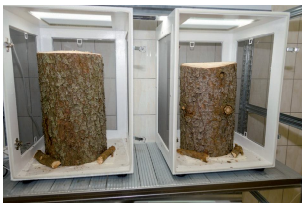
Obrázok 1. Chovné klietky so smrekovými klátmi, na ktorých sa chová tvrdoň

Chovné etapy prebiehajúce v rokoch 2010 – 2012 už boli publikované v práci ÚRADNÍK et al. , 2013. Chov prebiehal v klimatizovanej miestnosti v drevených klietkach s plastovou sieťovinou umožňujúcou prúdenie vzduchu. Na odchov sme použili čerstvé smrekové kláty (obr. 1) o priemeroch 16 – 18 cm a dĺžky 30 – 40 cm, v klietkach umiestnené vertikálne.