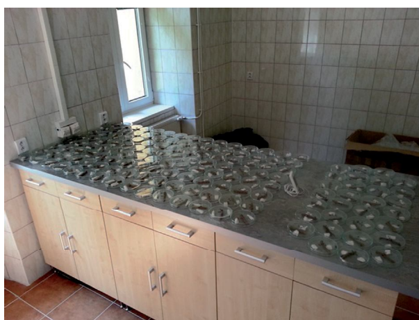
Obrázok 3. Priebeh pokusu entomopatogénnych húb na imágach tvrdoňa

Tretie opakovanie prebehlo od 23. apríla do 11. júna 2013 a použili sme huby I. fumosorosea odobratú z infikovaného hmyzieho jedinca, I. fumosorosea odobratú zo vzorky pôdy, M. anisopliae odobratú zo vzorky pôdy a B. bassiana z infikovaného imága tvrdoňa. V predchádzajúcich opakovaniach umiestnenie infikovaných imág do klimaboxov vyšlo ako menej priaznivé pre vývin húb, preto sme ich umiestnili do miestnosti (obr. 3), v ktorej teplota kolísala od 18 – 24 °C a vlhkosť okolo 50 % r.v.v.