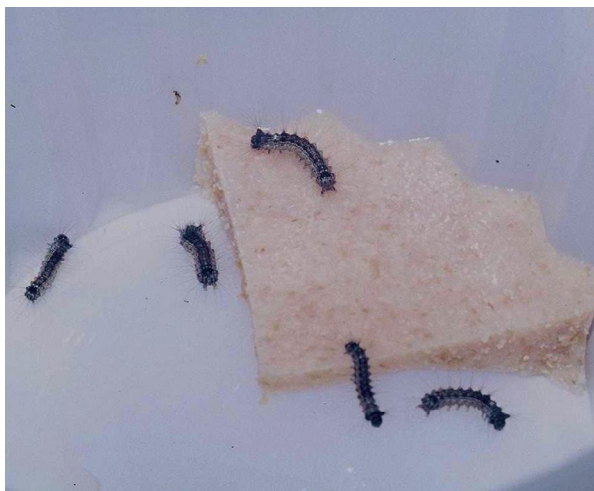
Obrázok 6. Húsenice mníšky veľkohlavej na umelej potrave