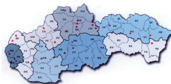
Obrázok 3. Lokality odberu vzoriek koreňovky (červené bodky)

Doposiaľ sme spracovali 150 vzoriek z 25 lokalít (obr. 3). Z TMP sme získali 90 vzoriek, herbárových položiek bolo 60 (najstaršia vzorka bola z roku 1868).