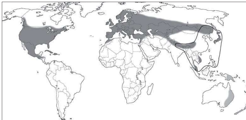
Obrázok 2. Globálne rozšírenie komplexu Heterobasidion s.l. (tmavo šedá plocha). H. araucariae (svetlo šedá plocha) a H. insular (čierno ohraničená plocha). KARI KORHONEN 2005

Vo svete je celkovo popísaných osem rôznych taxonomických druhov v rámci rodu Heterobasidion : H. annosum , H. parviporum , H. abietinum , H. araucariae , H. insular , H. pahangense , H. perplexum a H. rutilantiforme (NIEMELÄ a KORHONEN 1998) (obr. 2).