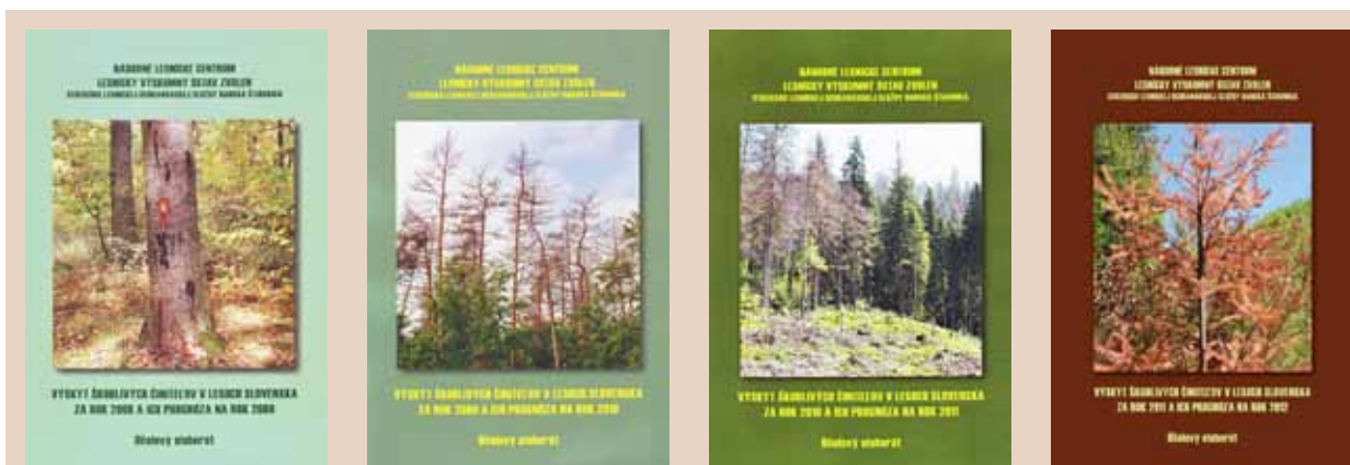
Obrázok 1. Titulné strany elaborátov „Výskyt škodlivých činiteľov v roku XY a prognóza na rok XY + 1“

Úlohy LOS v súčasnosti zabezpečujú výskumní pracovníci NLC – LVÚ Zvolen, Odboru ochrany lesa a manažmentu zveri. Ide o špecialistov na abiotické činitele, podkórny hmyz, listožravý a cicavý hmyz, patogénne huby, burinu a zver. Nové poznatky a skúsenosti získavajú z riešenia domácich a medzinárodných výskumných projektov ( www.los.sk ) a odovzdávajú ich lesníckej prevádzke. K spôsobom prenosu poznatkov výskumu do praxe patrí aj organizovanie každoročných medzinárodných konferencií „Aktuálne problémy v ochrane lesa“ ( www.los.sk/seminar.html ), vydávanie ročnej správy – elaborátu „Výskyt škodlivých činiteľov v lesoch Slovenska za rok XY a prognóza na rok XY + 1“ ( www.los.sk/elaborat.html ) a publikovanie odborných kníh ( www.los.sk/publikacie.html ). Sídlo LOS je v Banskej Štiavnici, časť špecialistov LOS pracuje vo Zvolene.