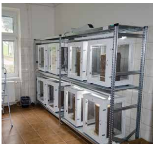
Obrázok 5. Laboratória LOS v Banskej Štiavnici