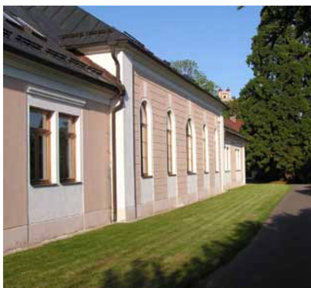
Obrázok 4. Budova LOS v Banskej Štiavnici