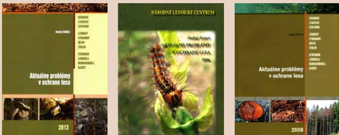
Obrázok 2. Titulné strany zborníkov referátov z medzinárodnej konferencie „Aktuálne problémy v ochrane lesa“