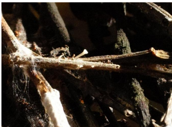
Obrázok 5. Mladá plodnica Hymenoscyphus pseudoalbidus na listových stopkách 1 rok po infekcii listu

Patogénna huba rastie v letnom období na listových stopkách na zemi v opade z minulého roka. Askospóry sa vytvárajú v pohlavných plodničkách (diskomycéty) v júli a v auguste a sú rozširované do okolia vetrom. Nie je známe, prečo je patogén tak agresívny. Predpokladá sa však, že nie je pôvodný v Európe, ale pochádza z Ázie, kde sú stromy voči tomuto patogénu odolnejšie. Zdá sa, že huba Lambertella albida rastúca v Ázii v Japonsku na jaseň Fraxinus manschurica , je tá istá, ktorá je v Európe známa pod súčasným názvom Hymenoscyphus pseudoalbidus .