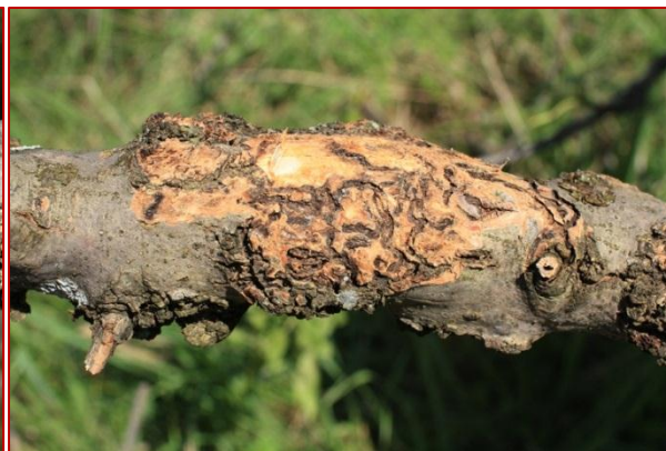
Obrázok 8. Otvorená ružica