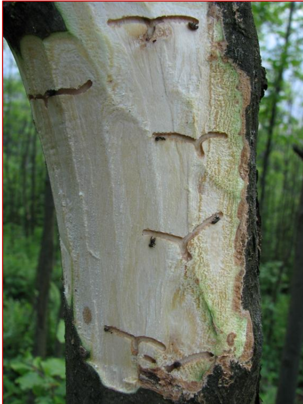
Obrázok 13. Charakteristický požerok lykokaza jaseňového Leperisinus fraxini v tvare „letiacej vrany“