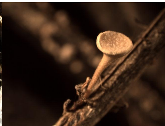
Obrázok 6. Zrelá plodnica Hymenoscyphus pseudoalbidus