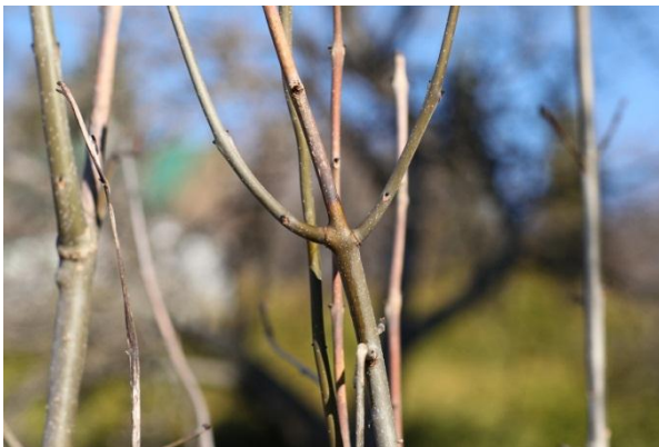
Obrázok 3. Nekróza prostredného výhonku z praslenu

Na vzorkách vetiev jaseňa sa vyskytujú difúzne nekrózy kôry (t.j. rozptýlené bez ostrého okraja) a odumieranie konárov od svojho vrcholu. Poškodenie pripomína spálenie jarným (neskorým) mrazom, za čo sa v škôlkach a vo výsadbách často zamieňa. Pod hnedým sfarbením kôry sú podkôrne pletivá už odumreté. Tieto nekrotické časti sú niekedy z okolitých pletív kalusované, avšak zvyčajne neúspešne. Pri dlhšom priebehu ochorenia (1 – 5 rokov) môžu byť na kmeni kvôli kalusovému pletivu vytvorené rakovinové rany. Častejšie dochádza k okrúžkovaniu a odumretiu celej časti nad miestom infekcie v prvom roku po infekcii.