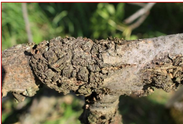
Obrázok 7. Ružice na kmeni jaseňa, v ktorých prebieha zrelostný žer imág