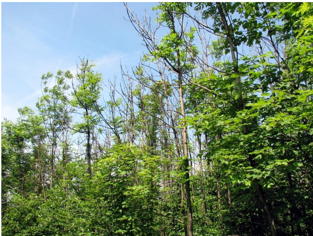
Obrázok 1. Mladý porast s príznakmi hynutia jaseňov

Porasty s príznakmi poškodenia sú zvyčajne vo veku do 30 rokov. Ide o mladiny, kde defoliácia jednotlivých stromov kolíše od 10 % do 90 %. Na stromoch ostávajú trčať konáre bez olistenia, podobne ako pri tracheomykózných ochoreniach napr. u dubov.