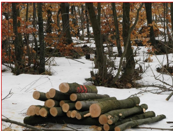
Obrázok 14. Klasické lapáky pripravené do pyramídy ešte na konci zimy kvôli skorému rojeniu lykokazov

Pri kontrole naletenia lapákov/lapacích polien je nevyhnutné skontrolovať aj spodnú stranu kmeňov, ktorú pri obsadzovaní lapákov lykokazy väčšinou uprednostňujú.