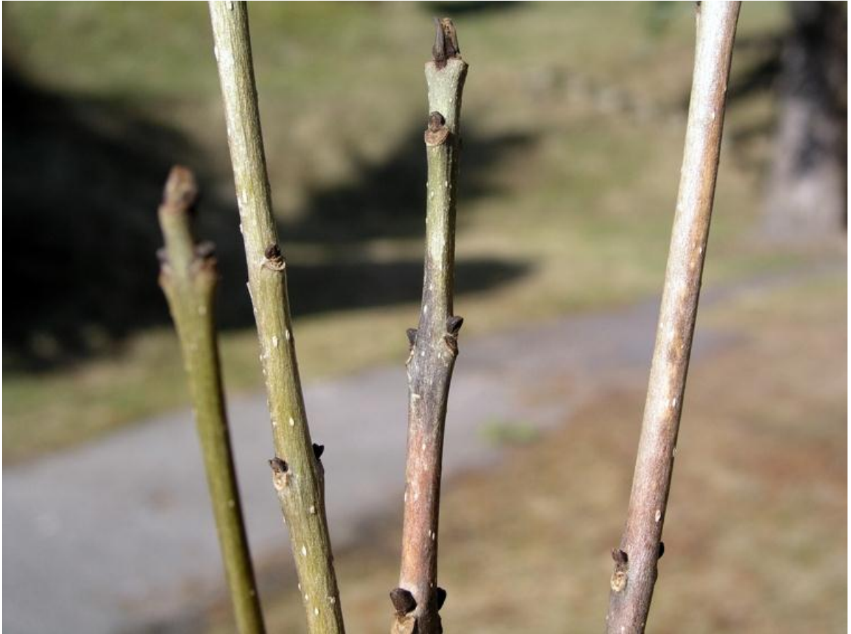
Obrázok 2. Difúzne nekrózy výhonkov sú zvyčajne približne 5 – 10 cm pod terminálnym púčikom

Na vzorkách vetiev jaseňa sa vyskytujú difúzne nekrózy kôry (t.j. rozptýlené bez ostrého okraja) a odumieranie konárov od svojho vrcholu. Poškodenie pripomína spálenie jarným (neskorým) mrazom, za čo sa v škôlkach a vo výsadbách často zamieňa. Pod hnedým sfarbením kôry sú podkôrne pletivá už odumreté. Tieto nekrotické časti sú niekedy z okolitých pletív kalusované, avšak zvyčajne neúspešne. Pri dlhšom priebehu ochorenia (1 – 5 rokov) môžu byť na kmeni kvôli kalusovému pletivu vytvorené rakovinové rany. Častejšie dochádza k okrúžkovaniu a odumretiu celej časti nad miestom infekcie v prvom roku po infekcii.