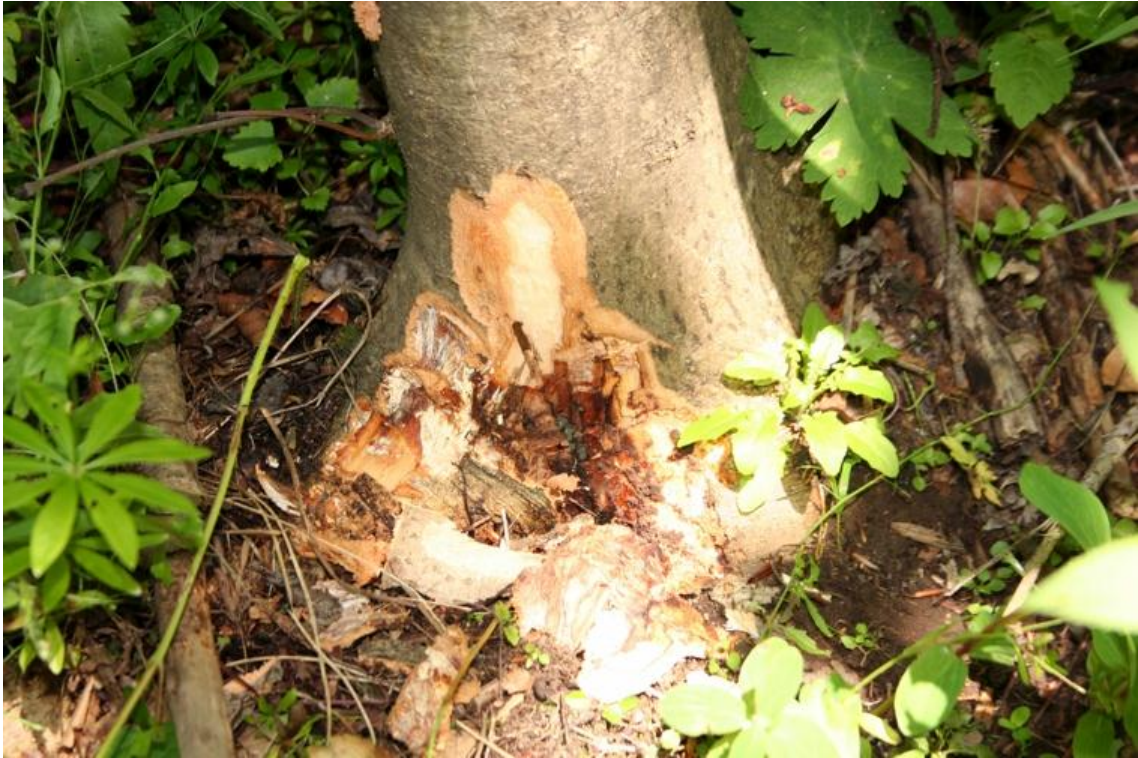
Obrázok 10. Syróciom podpňovky Armillaria na päte kmeňa je častým sprievodným príznakom hynutia jaseňov