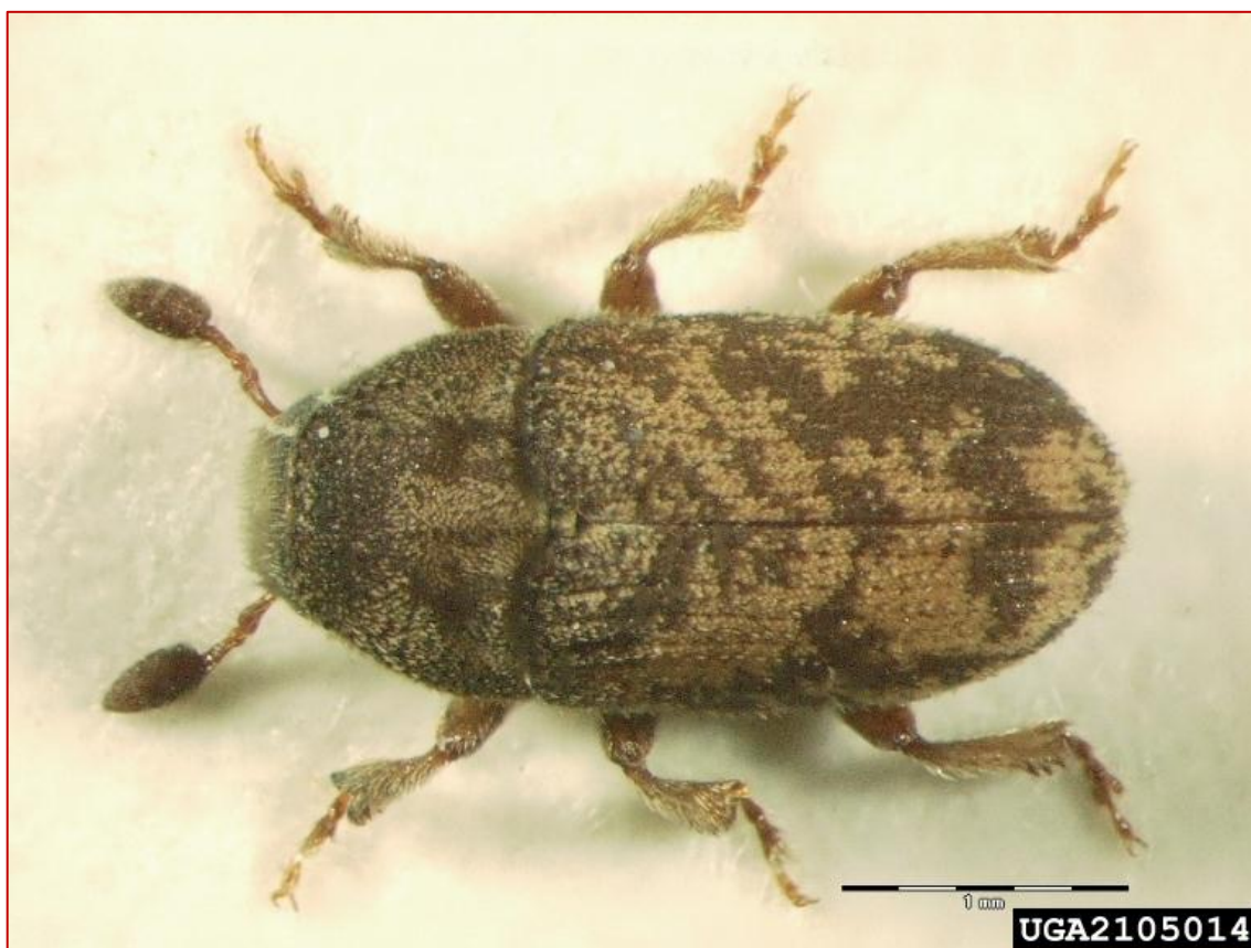
Obrázok 9. Leperisinus fraxini - imágo