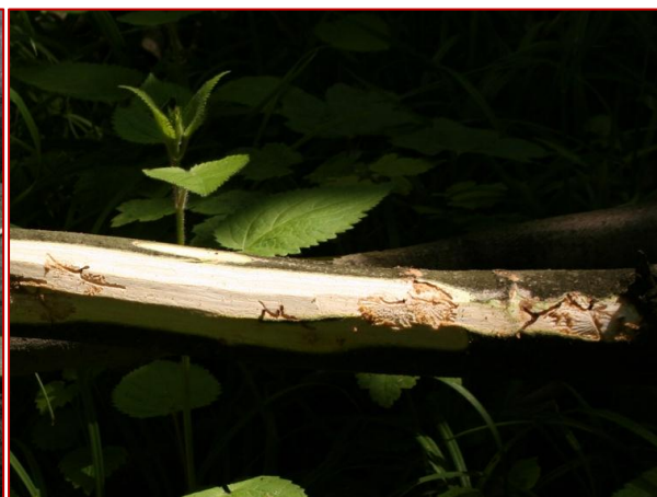
Obrázok 17. Požerok Leperisinus fraxini s takmer ukončeným vývojom lariev

Najvýznamnejším predpokladom udržania lykokaza jaseňového na nízkej hladine početnosti je prísna porastová hygiena!