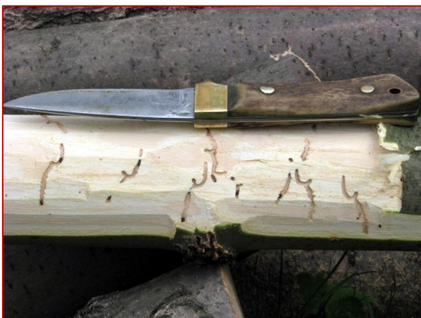
Obrázok 16. Vývoj Leperisinus fraxini dňa 6.5. – obdobie vhodné pre asanáciu lapákov