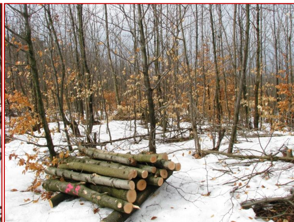
Obrázok 15. Lapáky môžu byť umiestnené aj priamo do porastov