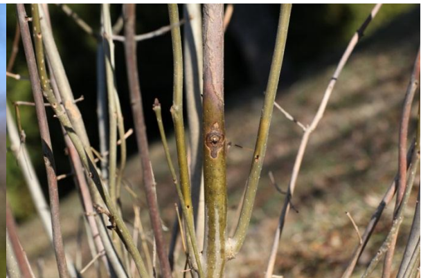
Obrázok 4. Nekróza sa šíri od miesta pripojenia listu na výhonok